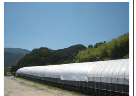
肉厚のシイタケを栽培しているハウス