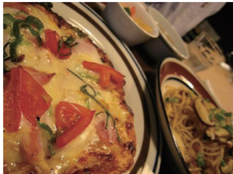
トマトの窯焼きピザなど、育てた野菜たちのカフェランチメニュー