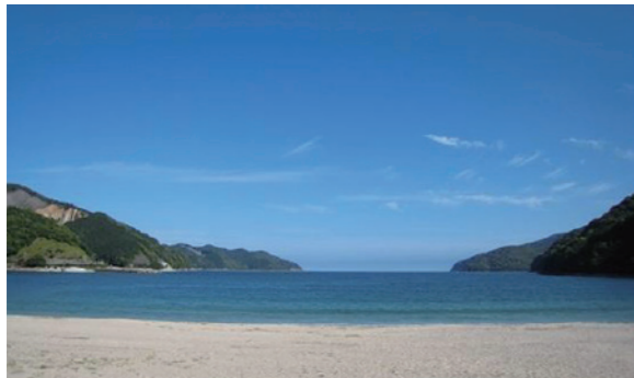
「やきやまふあーむ」のある三木里町の海水浴場

共に働く障害者の生活を守らなければ、そして地域で作った作物で、過疎が進むこの地域を元気にしなければという想いから売上UPは絶対使命と感じています。障害者就業支援A型事業所として、尾鷲に留まらず東紀州地域のモデルとなるよう、売上UPを目指し、6次産業化へ向けての新規事業に深く携わっていただきます。