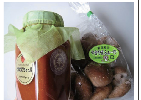
人気の「とまとけちやっぶ」とシイタケ